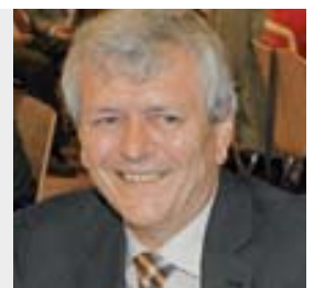
Franz Donauer Bayerisches Ministerium für Landwirtschaft und Forsten Ministerialrat, Leiter des Referates Marktangelegen- heiten für pflanzliche Erzeug- nisse, Ernährungsvorsorge

kungen oder sonstigen Ereignissen, die ein Verlassen der Wohnung nicht zulassen, wird er hilfreich sein. Der Lebensmitteleinzelhandel könnte durch entsprechende Angebote (Pakete) eine gute Hilfestellung bieten.