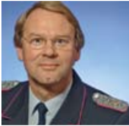
Gerd Bakeberg Kreisbrandmeister des Landkreises Celle

Einsatzerfahrungen bei den Waldbrandkatastrophen in der Lüneburger Heide 1975 und 1976, Einsatzleitung bei der Waldbrandkatastrophe 1992, Gesamteinsatzleiter der ICE-Katastrophe Eschede 1998